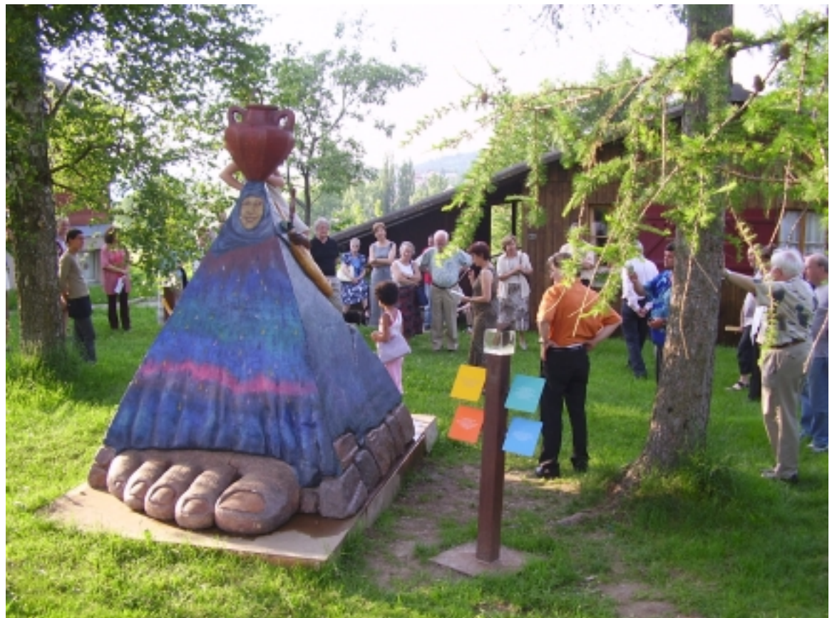
27 mai, centre national à Treyvaux: vernissage de l'exposition «Chemin de découvertes et de rencontres», ouverte tous les jours jusqu'au 17 octobre 2005